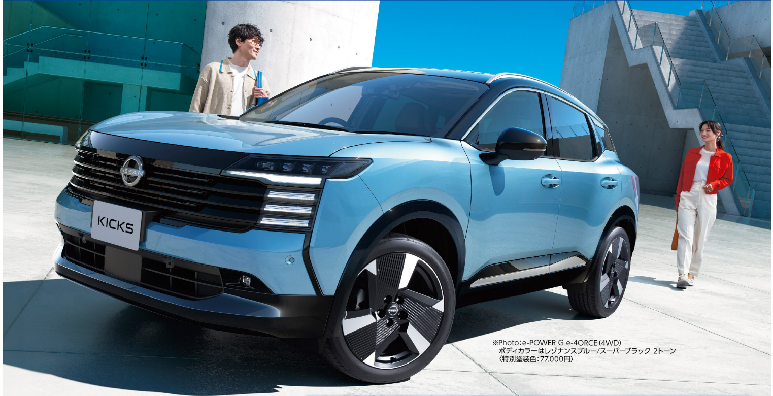
※Photo:e-POWER G e-4ORCE(4WD) ボディカラーはレゾナンスブルー/スーパーブラック 2トーン (特別塗装色:77,000円)

キックス e-POWER 4WD X+ e-4ORCE / 車両本体価格:4,230,600円